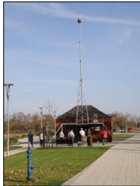
Sl.19) Memorijalni centar Nikole Tesle u Smiljanu.

Poslije panoramskog pogleda sa samog prijevoja, uputili smo se prema Gospiću. Uz put smo stali na označenoj točki poučne staze, gdje smo pogledali ostatke krpastog grebena iz razdoblja perma. Geološki program ekskurzije time je priveden kraju. No ovaj kraj krije i druge vrijednosti koje zaslužuju našu pažnju, te smo prije povratka u Zagreb svratili u Memorijalni centar Nikole Tesle (sl.19).