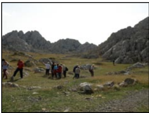
Sl. 13) Tulove grede.