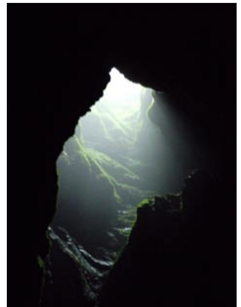
Svjetlo u tami (prirodno).

Niti ova Škola nije prošla suho. Gotovo poslovična kiša učinila je obilazak terena takvim, da smo poželjeli čim prije ući u podzemlje - tamo barem ne nosimo kišobrane.