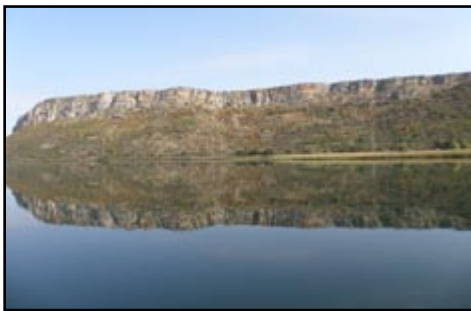
Sl. 8) Prominske naslage na putu prema Skradinu.