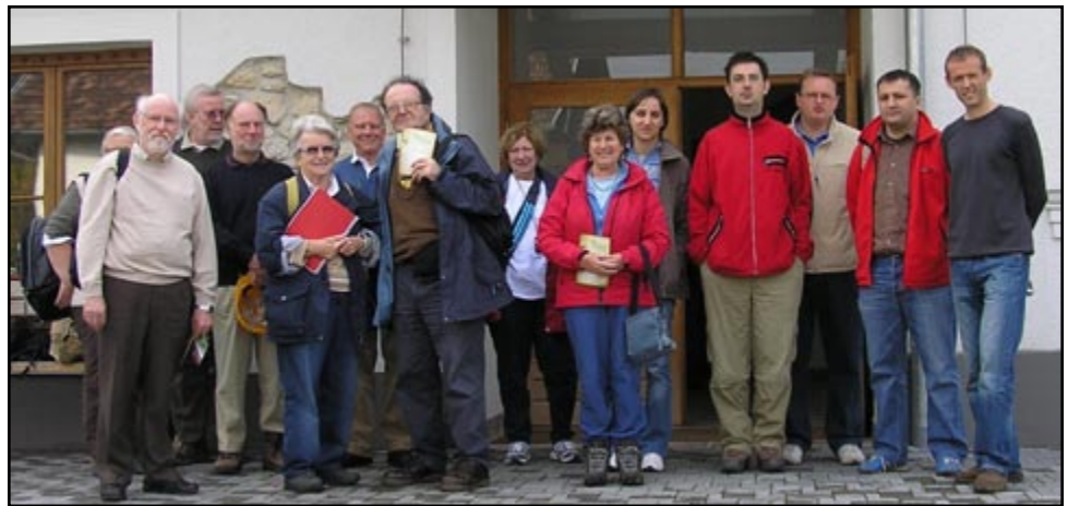
Sl. 2) Doček sudionika grupe OUGSME u Velikoj.

Grupu su na cijelom putu pratili Jasenka Sremac, Renato Drempetić i Karmen Fio, koji su za potrebe skupa pripremili