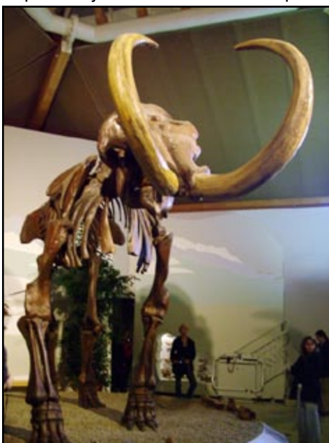
Rekonstrukcija mamuta kojeg su pronašli lokalni dječaci u igri i napola sami iskopali, i čuvali kao tajnu punih 10 godina!

i metodički ispravan i privlačan način, stalni postav muzeja prikazuje geološki razvoj Zemlje i geologiju južne Bavarske. Ekspoziti (uzorci stijena, fosila, minerala i dr.) nisu u vitrinama, i štoviše, vodič potiče posjetitelje da dotaknu ono što gledaju, kako bi opipom upotpunili proces spoznaje. U radu muzeja sudjeluje Udruga prijatelja prirodoslovnog muzeja u Siegsdorfu; a njena zadaća je promicanje muzeja i približavanje geologije javnosti, što čine volonterski putem javnih predavanja i radionica, podupiranjem raznih aktivnosti muzeja, vodstvom grupa po muzeju i sl. Glavna atrakcija Muzeja je mamut čija je replika (kostur) u prirodnoj veličini izložena uz prave