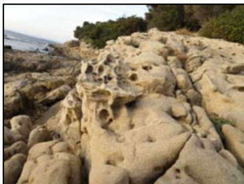
Sl. 15) Eocenske stijene s tragovima bioerozije na Loparu.

Poslije podne su se sudionici ekskurzije uputili na obilazak Lopara, gdje se oči otimaju za prekrasnim teksturama u eocenskim pješčenjacima (sl.15), a idealna je prilika i da se upoznate s modernim mehanizmima taloženja u priobalnim okolišima, gdje nastaju moderni stromatoliti, a fini se pijesak prerađuje djelovanjem morskih mijena, valova i vjetrova.