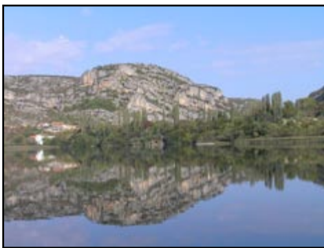
Sl. 7) Pogled s broda prema Roškom slapu.

Kraj dana začini smo s negeološkim sadržajima, te smo posjetili zadarske atrakcije – Forum (sl. 9), Morske orgulje i Pozdrav suncu (sl. 10).