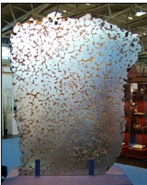
"Šnita" željeznog metaorita Mundrabilla koji je nađen u zapadnoj Australiji. Ukupna poznata masa ovog meteorita je 24 tone!

Prirodoslovni muzej južne Bavarske i Muzej mamuta u Siegsdorfu (Njemačka) nas je ugodno iznenadio inovativnim i zanimljivim postavom. Na didaktički