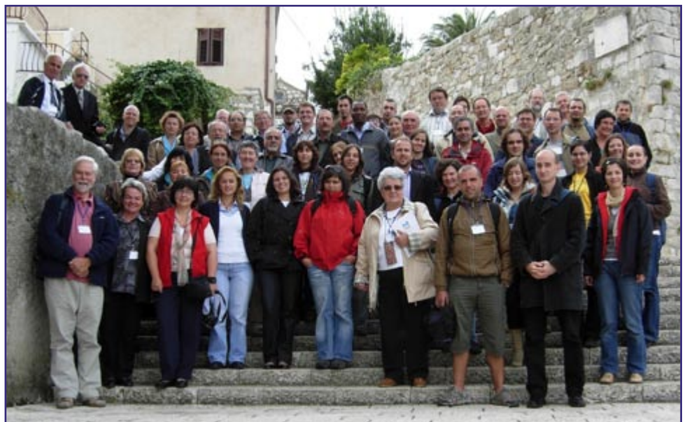
Sudionici skupa i novi predsjednik ProGEO-a dr. Bill Wimbledon, stoji prvi s lijeva.

Skupu je prisustvovalo 83 sudionika iz 18 država, među kojima je bilo i 12 portugalskih studenata i 17 studenata iz Zagreba. Tijekom skupa održana su 46 predavanja, i bilo je izloženo 18 postera. Valja naglasiti da je boravak naših stude-