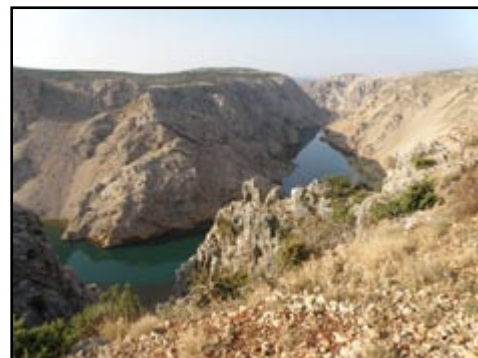
Sl.11) Pogled na Zrmanju.

lenice. Terenskim smo vozilima obišli 60-tak km ratnih puteva i puteva koje je iskrčila Šumarija. Teško je reći koja je padina Velebita ostavila ljepši dojam na naše goste. S morske strane nizale su se prekrasne slike, od Zrmanje do podvelebitskog primorja (sl.11), dok su zastori od raznobojnog lišća ukvirivali pomalo blatne i kvrgave šumske ceste na Ličkoj padini Velebita (sl. 12). Sudionici su naučili raspoznavati oštre reljefne oblike nastale u Jelar naslagama (sl.13) od okršenih jurskih vapnenaca i crvenkastim blatom obilježenih trijaskih terena.