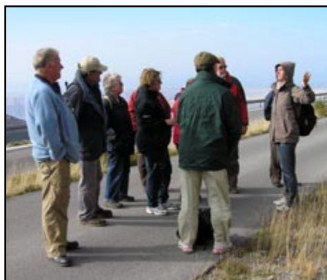
Sl 18) A sad malo starije geološke povijesti...

Poslije panoramskog pogleda sa samog prijevoja, uputili smo se prema Gospiću. Uz put smo stali na označenoj točki poučne staze, gdje smo pogledali ostatke krpastog grebena iz razdoblja perma. Geološki program ekskurzije time je priveden kraju. No ovaj kraj krije i druge vrijednosti koje zaslužuju našu pažnju, te smo prije povratka u Zagreb svratili u Memorijalni centar Nikole Tesle (sl.19).