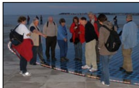
Sl.10) Instalacija Pozdrav Suncu na rivi.

Četvrtog dana ekscurzije nastavili smo obilazak naših nacionalnih parkova, te smo posjetili područje Pak-