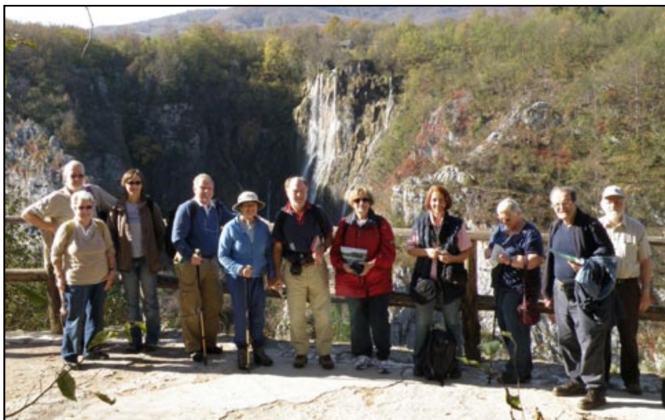
Sl. 5) Slikanje na vidikovcu sastavni je dio svake ekscurzije.

Uz toplo i sunčano vrijeme sudionici su proveli prekrasno jutro u Nacionalnom parku Plitvička jezera (sl.5). Ovdje su se upoznali s geološkom građom Krških Dinarida, te glavnim karakteristikama najpoznatijeg hrvatskog krškog fenomena.