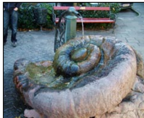
Jedna od atrakcija Göllinga je i ova fontana napravljena od pravog amonita koji potječe iz Adnet-vapnenaca!

Nakon ugodnog noćenja u Hotelu Torrennerhof u Göllingu (Austrija), plan puta odveo nas je u Hallein, gradić južno od Salzburga, poznat po obližnjem rudniku soli Bad Dürrenberg. Rudnik danas nije aktivan, već je poučna i zabavna turistička atrakcija koja privlači velik broj posjetitelja iz čitave Europe i šire (to je najstariji turistički rudnik u Europi koji je prve turiste primio već prije 300 godina!). Uz vodiča (zapravo dva; pravog vodiča i virtualnog - nadbiskup Wolf Dietrich von Raitenau iz 16. stoljeća - koji "prati" grupu putem igrano-dokumentarnog filma) saznali smo na koji način se u tom i sličnim rudnicima vadi(la) sol, iskusili smo vrtoglave rudničke tobogane - nekada jedini način za spuštanje na niži horizont, te smo se vozili na splavi po podzemnom slanom jezeru.