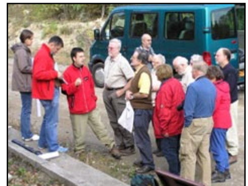
Sl. 3) Sudionici skupa na geološkoj točki Vrhovci.

Drugog dana ekscurzije krenuli smo od Zagreba prema jugu, prema krškim Dinaridima, gdje ćemo provesti sljedećih pet dana.