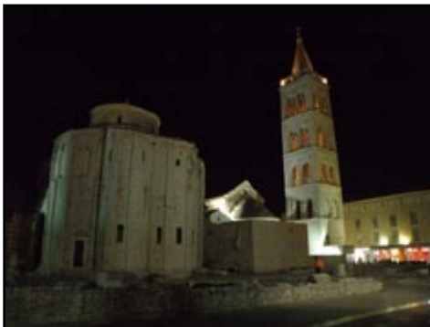
Sl. 9) Zadarski Forum.

Četvrtog dana ekscurzije nastavili smo obilazak naših nacionalnih parkova, te smo posjetili područje Pak-