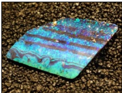
Australski "dragi" opal. Veličina kutije cigareta!

Mineralientage je održan na preko 36.000 m 2 izložbenog prostora, s više od 1.000 izlagača iz preko 56 država svijeta. Ovaj je put zaista bio "svjetski" i po tradicionalno spektakularnim izložbama koje su posjetitelje vodile od daleke Australije do "Zlata Alpa". Već na samom ulazu u velesajam iznenadio nas je kompletan fosil (iako složen iz više dijelova) impresivne divovske papratnjače.