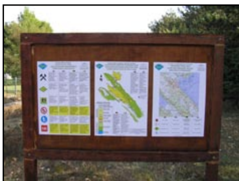
Sl. 14) Početak poučne staze na ulazu u Lopar.