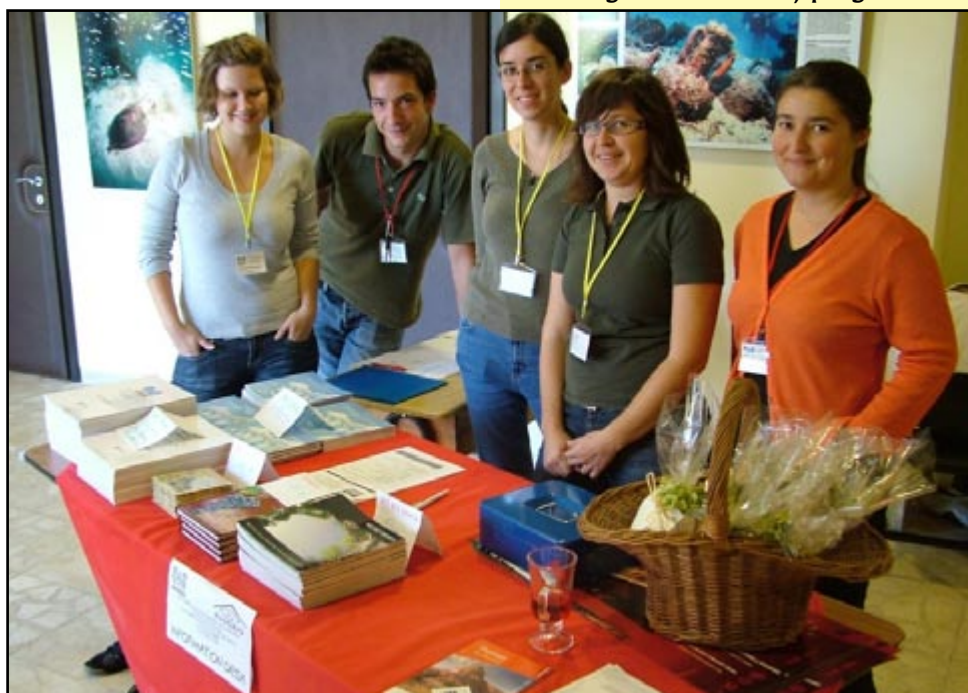
Dio studentske tehničke ekipe koja je uspješno odradila velik posao tijekom svih 7 dana skupa. Na slici nedostaju Pavica i Andre.