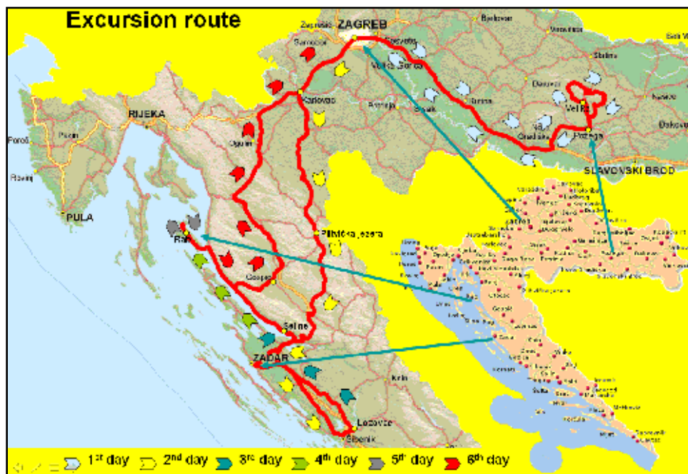
Sl.1) Trasa ekscurzije OUGSME Geo-trip Croatia 2008 (Sremac et al., 2008).