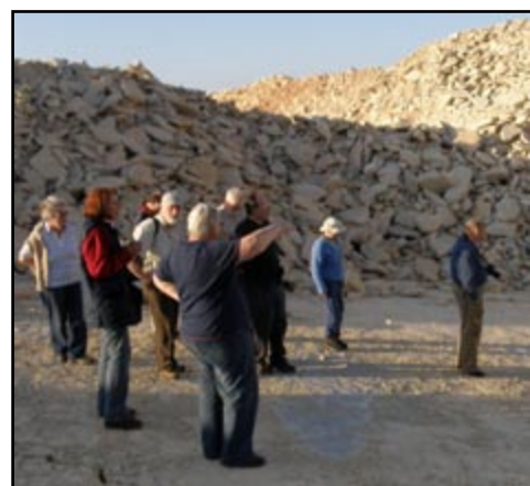
Sl. 6) Na naše je goste osobiti dojam ostavila slojna ploha s valnim brazdama, koju su nazvali „fosilnom plažom“.

Tijekom šetnje po Nacionalnom parku naši su gosti primijetili zanimljive fosilne tragove u kamenu kojim su popločane staze. Stoga smo ih poslije podne poveli u Benkovac, kako bi se upoznali s karakteristikama, postankom i eksploatacijom Benkovačkog kamena (sl.6).