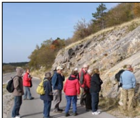
Sl.17) Jurski vapnenci ispod prijevoja Kubus.

Tijekom vožnje prema Kubusu neki su od sudionika i zadrijemali, no uskoro ih je razbudio prekrasan pogled na more i suncem okupane otoke. Zastali smo prije samog prijevoja, kako bi se naši gosti upoznali s donjojurskim dobro uslojenim vapnencima, te naučili raspoznavati neke osobito zanimljive stijene, kao što su litiotidne kokine (sl.17), a čuli su i najnovije podatke o granici perm/trijas na ovom području (sl. 18).