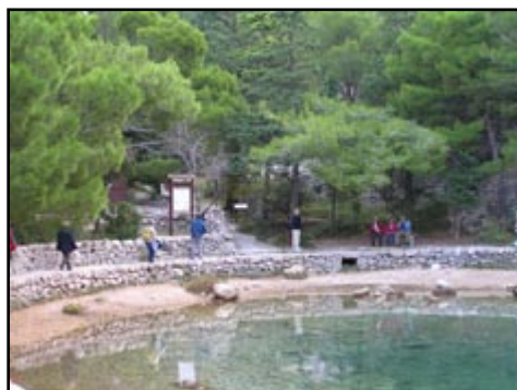
Sl. 16) Kratki odmor u Zavratnici.

Stigao je i zadnji dan ekskurzije, te smo se uputili prema Zagrebu. No sunčano nas je jutro zadržalo uz obalu, gdje smo prvo posjetili Zavratnicu (sl.16).