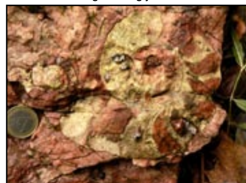
Slika 3: Amoniti