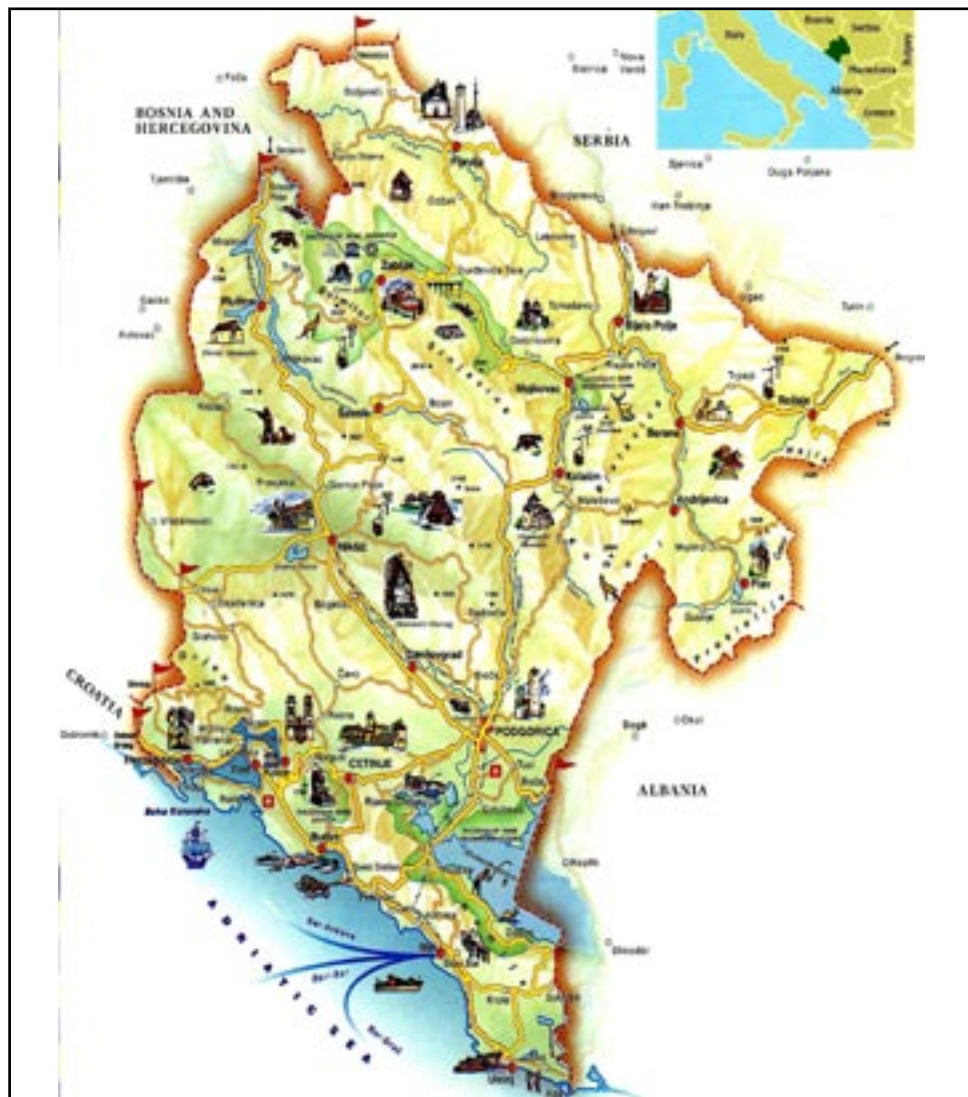
Slika 1: Turistička karta Crne Gore (www.montenegromap.net)