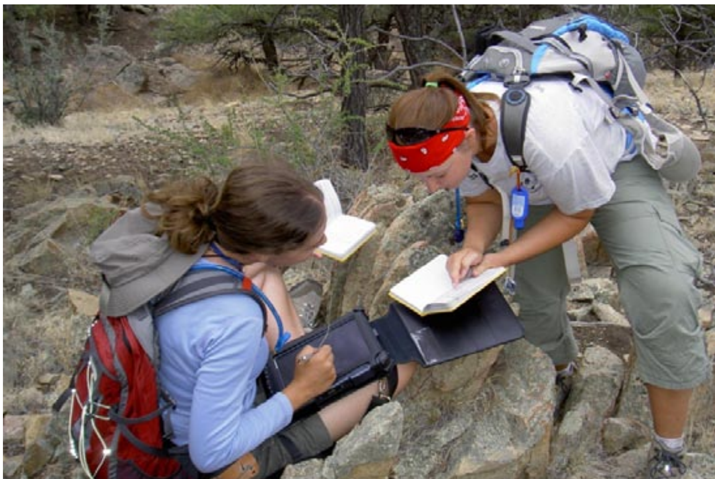
Studenti Bowling Green State University na terenskoj nastavi koriste GeoPad (terenski laptop) za zapis geoloških opažanja, ali istovremeno vode i klasični terenski dnevnik. [ http://serc.carleton.edu/NAGTWorkshops/field/workshop10/overview.html ]

Gdje smo mi u toj priči, i kakve to ima veze s nama? Umjesto odgovora, pokušajte razmisliti dragi čitatelji, kako to studenti percipiraju našu struku i svoju ulogu u njoj, kad od 12 anketiranih studenata, svih 12 priželjkuje izraditi diplomski rad u kojem nema kartiranja i za koji ne bi trebali puno (ili uopće) raditi na terenu? Zar je terenski rad zaista toliko prezren, ili toliko težak da ga se ti dvadeset-i-nešto godišnjaci boje? Ako je tako, zašto? Ili su im napredne laboratorijske tehnike istraživanja toliko privlačnije? Pitanje je samo, tko će ih, s takvim stavom zaposliti?