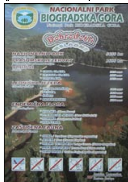
Slika 2: Informativna ploča kod Biogradskog jezera

„lunch“ paketa krenuli u obilazak jezera. Kako je društvo bilo šaroliko, nekog su oduševljavali kukci i pastreve, nekog lišajevi i gljive na stablima, a mi geolozi smo možda bili najviše u čudu, jer je na šetnici oko jezera bilo moguće naći sve tri gore navedene vrste stijena.