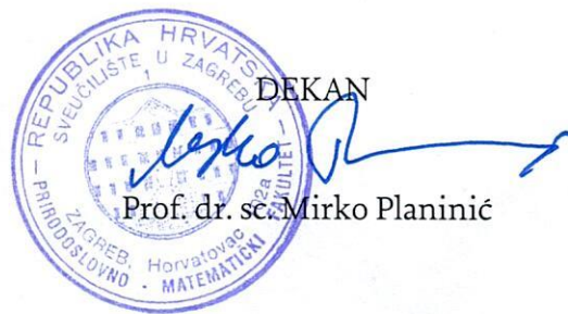
Prof. dr. sc. Mirko Planinić

Ovaj Pravilnik objavljen je na oglasnoj ploči i internetskoj stranici Sveučilišta u Zagrebu Prirodoslovno-matematičkog fakulteta, Geografskog odsjeka 27. 9. 2023. i stupa na snagu 5. 10. 2023.