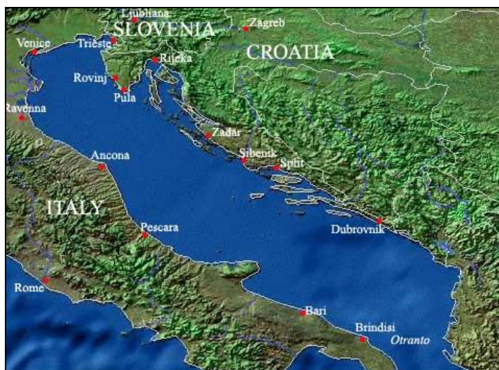
Slika 3 Jadransko more