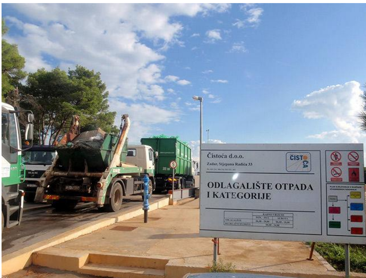
Slika 5. Odlagalište otpada Diklo – Zadar

Odlagalište neopasnog otpada “Diklo” službeno je odlagalište grada Zadra. Odlaganje otpada na toj lokaciji započelo je još 1963. Godine, a dana odlagalište zauzima površinu oko 60,33 ha. Cjelokupan komunalni otpad s područja grada Zadra odlaže se na odlagališta otpada Diklo i sigurno je da će se takva praksa nastaviti sve do izgradnje županijskog centra za gospodarenje otpadom koje je predviđeno za izgradnju u Biljanima Donjim. Na području grada Zadra uključujući i otoke u administrativnom sustavu grada ( Silba, Molat, Olib, Ist, Iž, Rava, Premuda) usluge odvoza i odlaganja komunalnog otpada obavlja Čistoća d.o.o Zadar. Na odlagalište Diklo svakodnevno se odlaže otpad iz grada Nina, općina Privlaka, Vrsi, Ražanac, Posedarje, Poličnik, Galovac, Zemunik Donji, Sukošan, Novigrad i Škabrnja, te otoka koji administrativno pripadaju gradu Zadru.