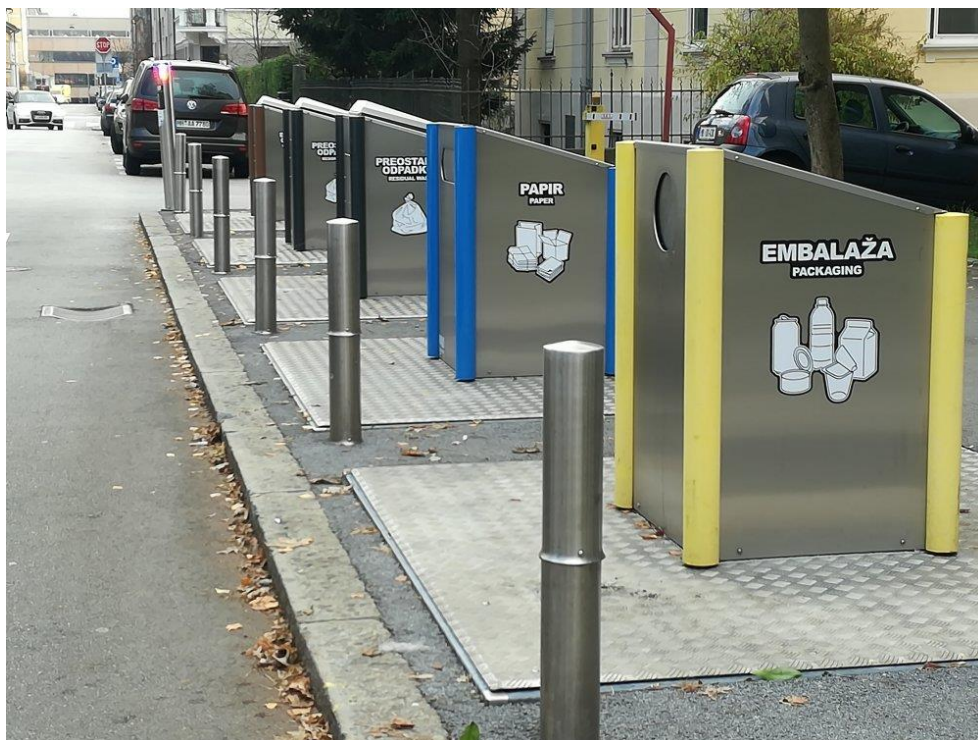
Slika 7. Podzemni spremnici za odlaganje komunalnog otpada

Važno je istaknuti kako je Ljubljana započela s odvojenim sakupljanjem otpada još 2002. godine. U 2006. godini javno poduzeće Snaga, ujedno i najveća tvrtka za upravljanje otpadom u Sloveniji, započela je s prikupljanjem biootpada na kućnom pragu za sva kućanstva, a čak 82% ih je bilo uključeno. Ciljevi grada Ljubljane do 2025. godine su sljedeći: