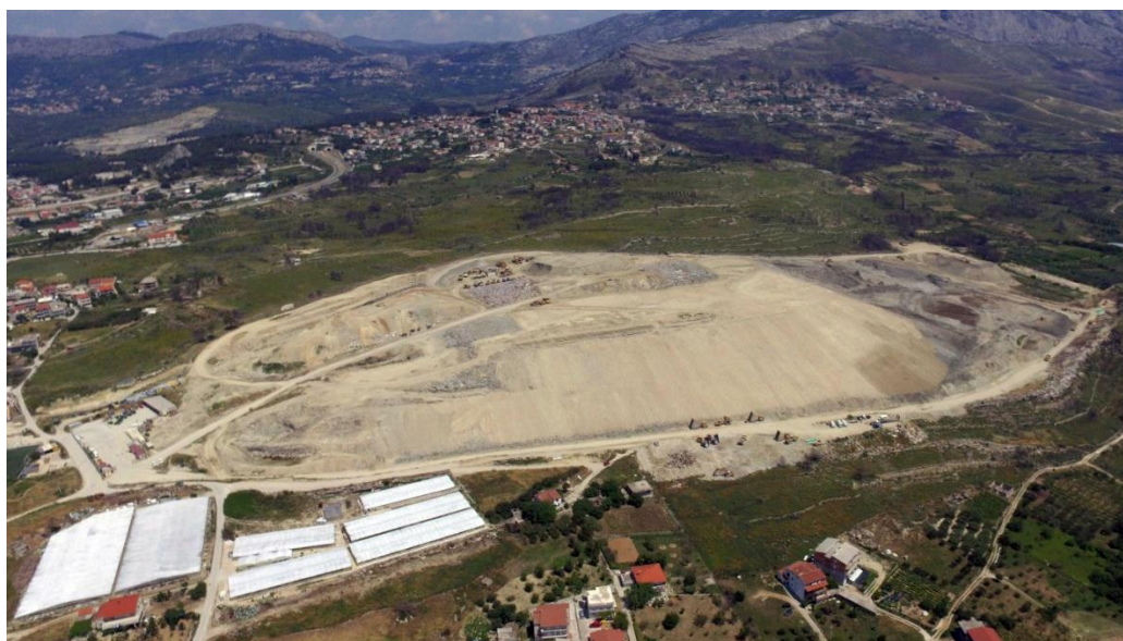
Slika 6. Odlagalište otpada Karepovac - Split

Plan gospodarenja otpadom grada Splita za razdoblje 2016 do 2022. godine predstavlja temeljni dokument koji će poslužiti kao osnova za uvođenje cjelovitog sustava gospodarenja otpadom u administrativnim granicama grada Splita. Svrha ovog plana je definirati okvir za održivo gospodarenje otpadom koje obuhvaća skup aktivnosti, odluka i mjera usmjerenih na sprječavanje nastanka otpada, smanjivanja količine otpada, provedbu sakupljanja, prijevoza, uporabe, zbrinjavanja i drugih aktivnosti vezanih za otpad, nadzor nad obavljanjem tih djelatnosti kao i skrb za postojeća i divlja odlagališta otpada.