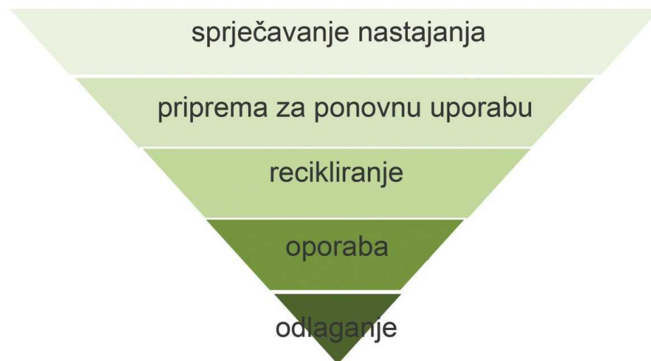
Slika 2. Hijerarhija gospodarenja otpadom

Odlaganje otpada na odlagalištima podrazumijeva svako djelovanje koje nije oporaba, čak i u slučaju u kojem tijekom postupka dolazi do sekundarnih posljedica u obliku obnavljanja tvari ili energije (Tišma, Boromisa, Funduk, Čermak, 2017).