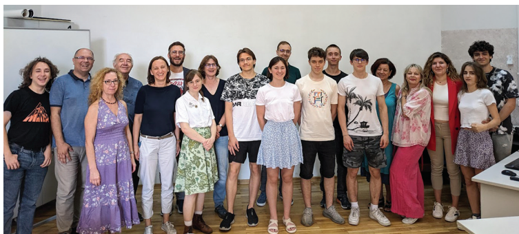
MIOC, 20. lipnja 2024.

Svi prisutni na prezentacijama oba dana bili su više nego iznenađeni s uložnim trudom učenika. Iz svake prezentacije izvirao je nevjerojatni mladenački entuzijazam i posvećenost obradi zadane teme. Za neke prezentacije su čak nastavnici PMF-a rekli da bi ih rado koristili na svojim predavanjima studentima.