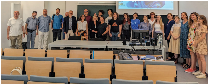
PMF, 19. lipnja 2024.